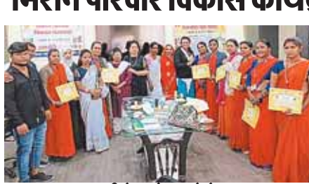
सीहोर, दोपहर मेट्रो

मिशन परिवार विकास कार्यक्रम के तहत जिला अस्पताल में नव दंपति सम्मेलन आयोजित किया गया। सम्मेलन में 15 नव विवाहित जोड़ों को नई पहल कित का वितरण किया गया। इसके साथ ही आशा कार्यकर्ताओं को