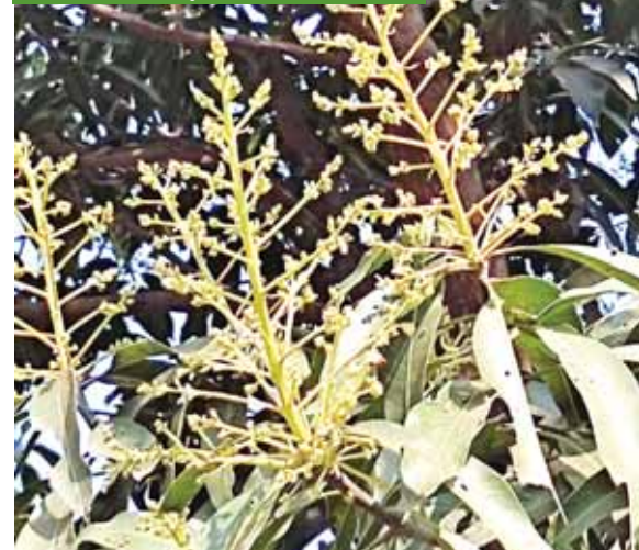
भोपाल। वसंत ऋतु के शुरू होते ही आमों में आया बोर।