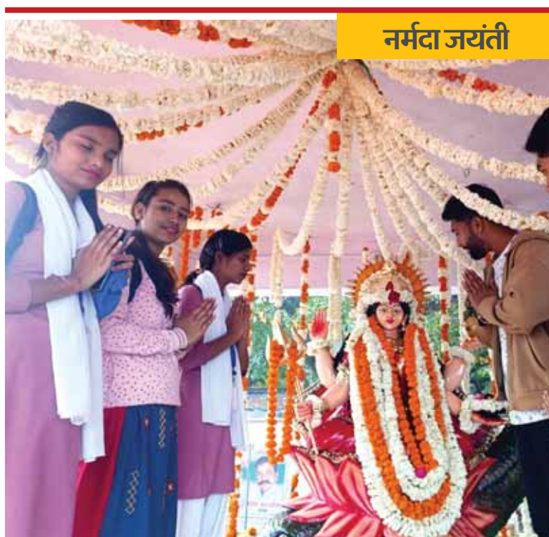
भोपाल। शीतलदास की बगिया में नर्मदा जयंती पर हुआ पूजापाठ।

समाधान शिविर के सफल आयोजन के लिए गुरुवार को जिला एवं सत्र न्यायालय के सभाकक्ष में बैठक हुई। इसके साथ ही प्रशिक्षण कार्यक्रम का आयोजन कर समाधान शिविर में उनकी भूमिका के बारे में अवगत कराते हुए समाधान शिविर के माध्यम से आमजन की समस्याओं का निराकरण कराए जाने के लिए अधिक से अधिक प्रचार-प्रसार कर समाधान शिविर को सफल बनाने के लिए समुचित प्रयास किए जाने के लिए निर्देशित किया।