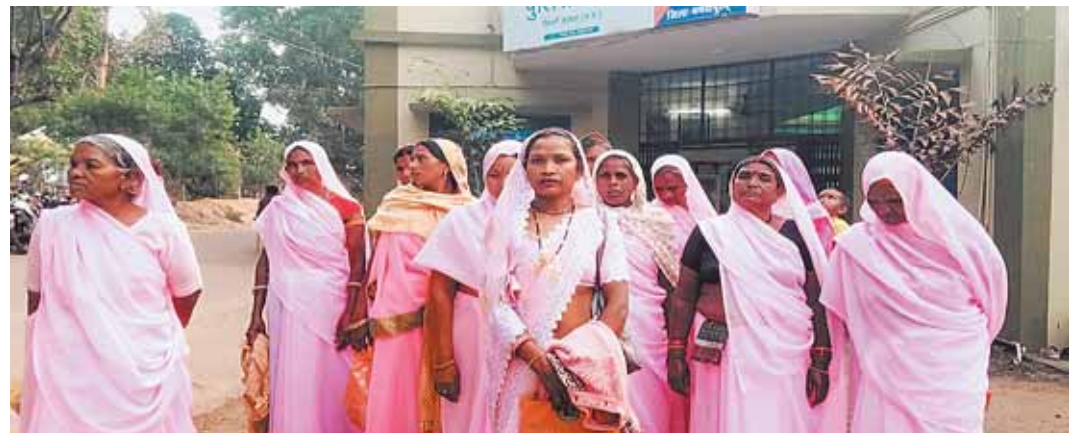
सिवनी मालवा, दोपहर मेट्रो।

ग्राम पंचायत पीपलटोन के अंतर्गत आने वाले ग्राम खावरापुरा की लगभग एक दर्जन स्वसहयता समूह की महिलाओं ने गांव में अवैध रूप से बेची जा रही अंग्रेजी शराब को बंद करने के लिए अनुविभागीय अधिकारी एवं थाना प्रभारी को एक ज्ञापन देकर अवैध रूप से बेची जा रही शराब को बंद करने की मांग की। महिलाओं का कहना है कि खावरा पूरा में नहर के पास