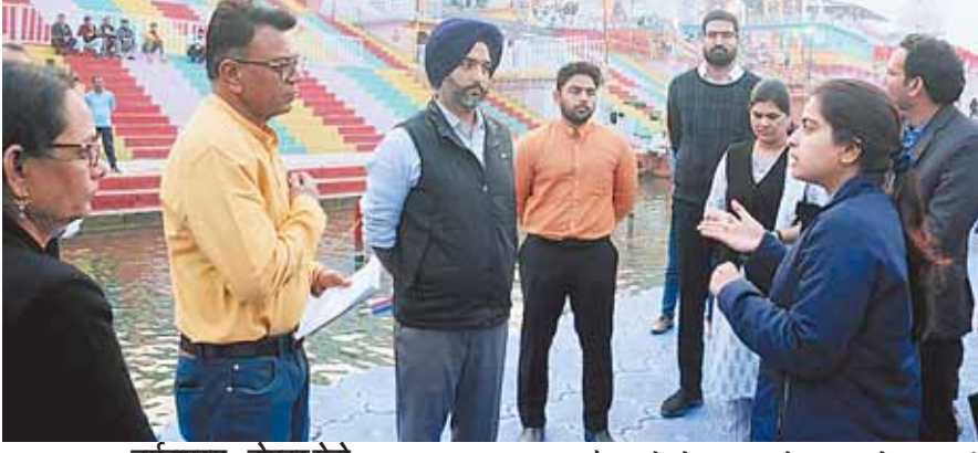
नर्मदापुरम, दोपहर मेट्रो

नर्मदा जयंती के अवसर पर श्रद्धालुओं की सुविधा एवं व्हीआइपी भ्रमण की संभावना को दृष्टिगत रखते हुए यातायात व्यवस्था में परिवर्तन किया गया है जो निम्नानुसार है।