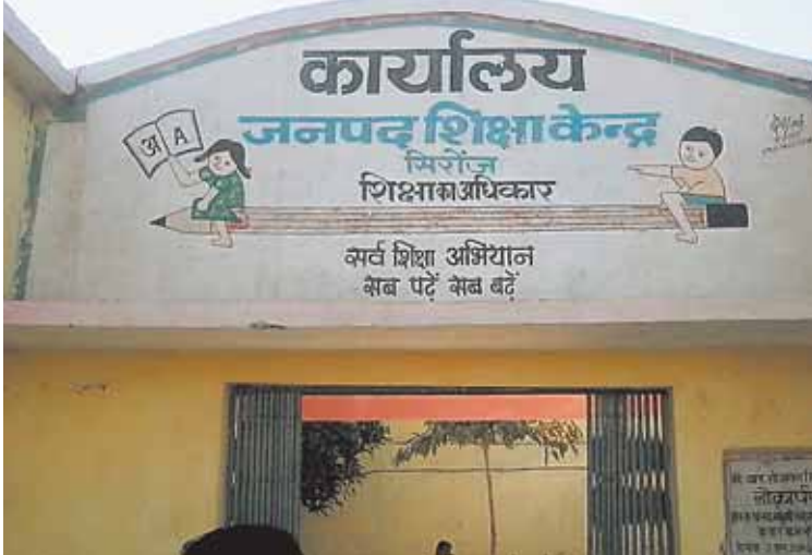
सिरोंज, दोपहर मेट्रो।

छात्र-छात्राओं के पालकों की बढ़ाई मुरिकलें, होगी कम उपस्थिति