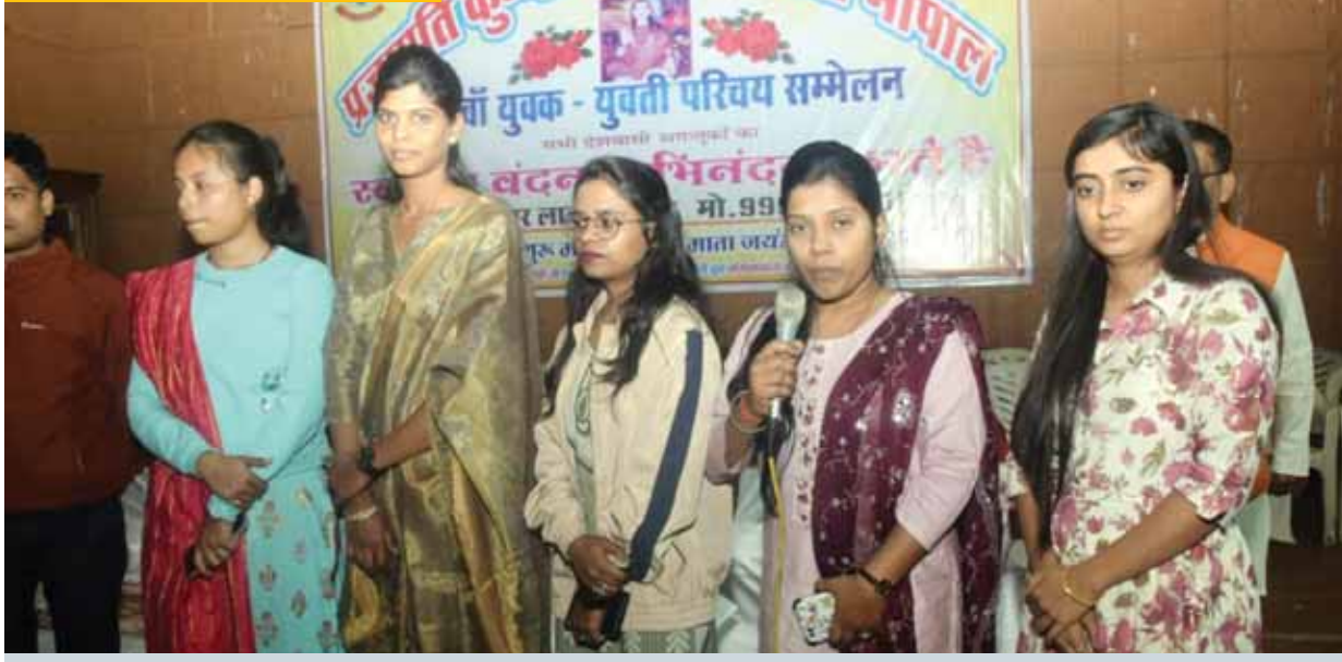
भोपाल। गांधी भवन में प्रजापति कुम्भकार समाज संघ का युवक-युवती परिचय सम्मेलन हुआ।