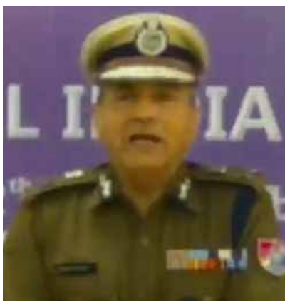
बीच उल्कृष्टता एवं सहयोग को बढ़ावा देना है।

इस कार्यक्रम के आयोजन की जिम्मेदारी अखिल भारतीय पुलिस ड्यूटी सम्मेलन की केंद्रीय समन्वय समिति ने रेलवे सुरक्षा बल को सौंपी है। कानून प्रवर्तन से जुड़े लोगों के बीच प्रसिद्ध इस कार्यक्रम का उद्देश्य आंतरिक सुरक्षा को बढ़ाने के लिए अपराधों की वैज्ञानिक पहचान और जांच की दिशा में पुलिस अधिकारियों के