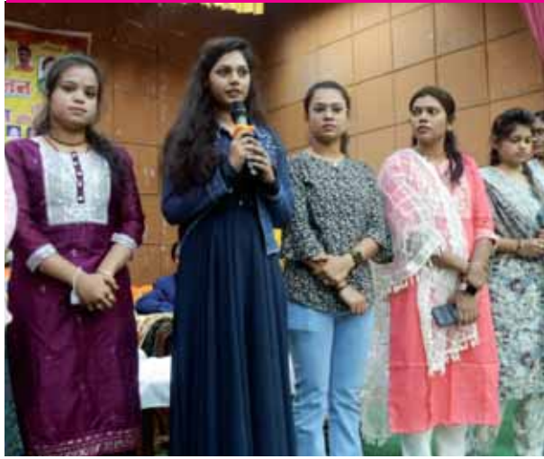
भोपाल के गांधी भवन में प्रजापति समाज का युवा युवित परिचय सम्मेलन का आयोजन