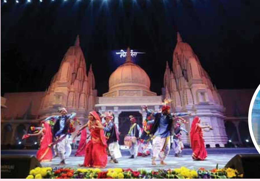
भोपाल। रविंद्र भवन के मुक्त आकाश मंच पर लोकरंग उत्सव जारी है। इसमें प्रस्तुत सांस्कृतिक कार्यक्रमों के दृश्य।