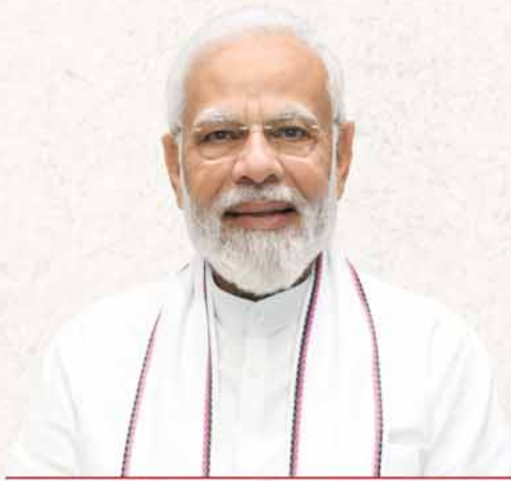
नरेन्द्र मोदी, प्रधानमंत्री