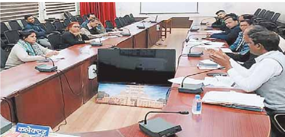
रायसेन, दोपहर मेट्रो।