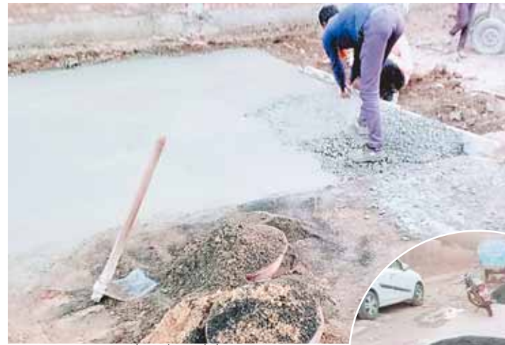
सिरोंज, दोपहर मेट्रो।

नगरीय क्षेत्र में अधिक जगह गुणवत्ता युक्त निर्माण कार्य नहीं हो रहा है। इसकी वजह से सड़क बनने के चंद दिनों के बाद ही गड़ों में तब्दील होने लगते हैं। घटिया काम की शिकायत मिलने पर विधायक के द्वारा भी कई बार जिम्मेदारों को खूब खरी खोटी भी सुनाई है फिर भी इनके रवैया में परिवर्तन नहीं हो रहा है। कई बार जानकारी होने के बाद भी नगर पालिका परिषद के जिम्मेदारों के द्वारा कोई ध्यान नहीं दिया जाता है। इसका फायदा उठाकर ठेकेदार लीपापोती करके निर्माण कार्य कर देते हैं और सीसी सड़कें भ्रष्टाचार की भेंट चढ़ जाती हैं ऐसे कई सड़कें पहले भ्रष्टाचार की भेंट चढ़ चुकी है जिनको दोबारा से बनवाया जा रहा है। गुणवत्ता युक्त निर्माणकारी हो उसके लिए उपयंत्रि तैनात किए