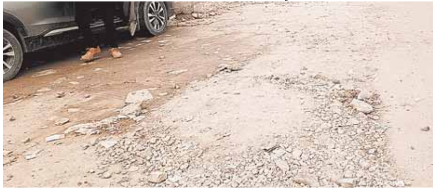
सिरोंज, दोपहर मेट्रो।

22 जनवरी को नगर को साफ स्वच्छ व सुंदर बनाने के लिए सरकार के द्वारा भी निर्देश दिए गए हैं। क्षेत्रीय विधायक के द्वारा भी लगातार दिशा निर्देश जारी किए जा रहे हैं। दूसरी ओर लिंक रोड की सड़क बनाने वाले सड़क ठेकेदार के आगे सभी बेसर होते हुए दिखाई दे रहे हैं। तभी तो सड़क बनाने के बाद ठेकेदार अपने हिसाब से काम को अंजाम देकर सड़क पर गंदगी छोड़ दी है आधा अधूरा काम छोड़ दिया वहीं निर्माण के दौरान जो भी मटेरियल खराब था तलाई के लिए डाला गया सामान भी सड़क पर ही छोड़ दिया गया इस वजह से जगह-जगह कचरा के ढेर लगे हुए हैं। पत्थर पड़े हुए हैं इस वजह से वाहन चालकों के साथ रहवासियों आसपास के दुकानदारों को भी परेशानी हो रही है। सड़क की गुणवत्ता को लेकर लगातार प्रश्न चिन्ह खड़े हो रहे हैं। कुछ महीने पहले तो विधायक के द्वारा मुख्यमंत्री से लेकर नगरी प्रशासन के अधिकारियों शिकायत भी की गई थी जांच के नाम पर खाना पूर्ति हो गई। इस वजह से ठेकेदार की हौसले भी बुलंद दिखाई दे रहे हैं ठेकेदार अपने हिसाब से सड़क का निर्माण करके खानापूर्ति कर रहा है इसको