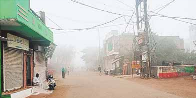
सिरोंज, दोपहर मेट्रो।

पिछले तीन दिनों से मौसम में हुए बदलाव के बाद सर्दी का ऐसा सितम प्रारंभ हुआ है कि जिसके कारण सभी की हालत खराब हो रही है दिन में ही कप कप देने वाली सर्दी का दौर जारी है। सुबह-शाम तो घरों से निकलने में लोगों की