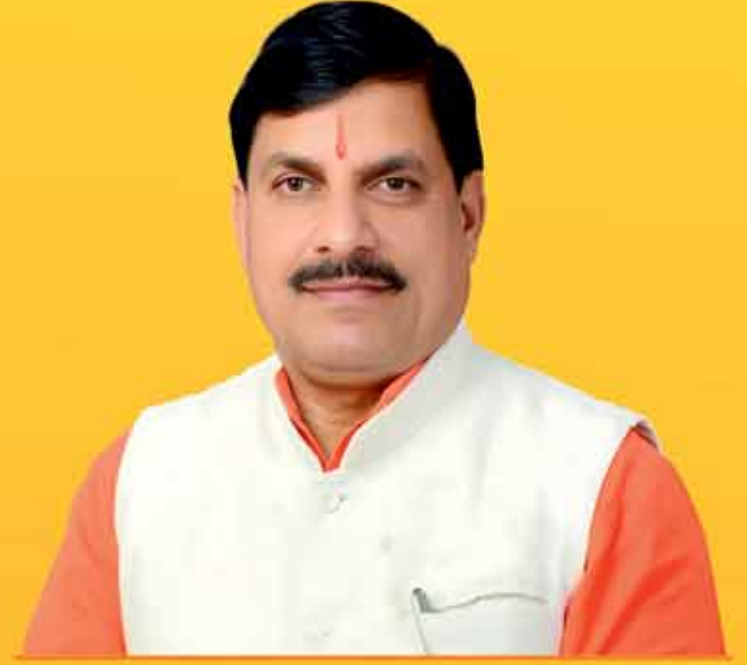
डॉ. मोहन यादव, मुख्यमंत्री