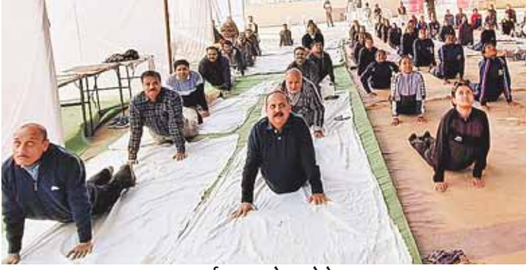
नर्मदापुरम, दोपहर मेट्रो