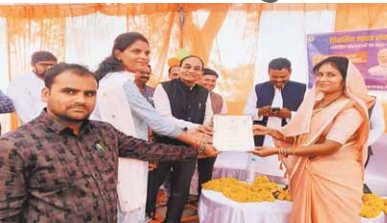
सिवनी मालवा, दोपहर मेट्रो