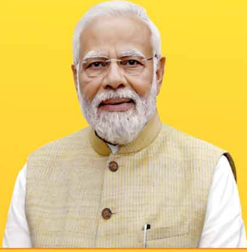
नरेन्द्र मोदी, प्रधानमंत्री