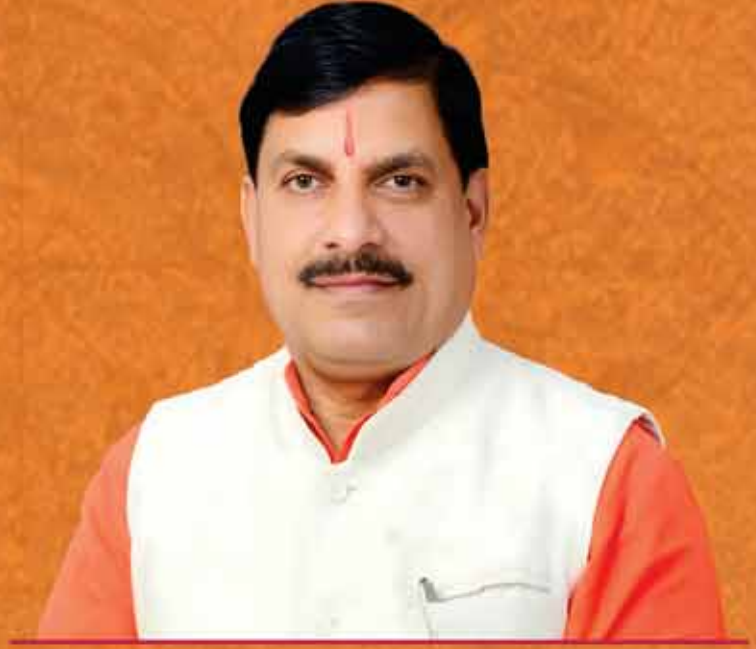
डॉ. मोहन यादव, मुख्यमंत्री