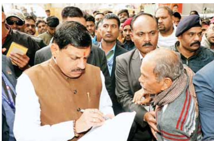
मुख्यमंत्री डॉ. मोहन यादव ने आज विन्ध्य कोठी स्थित निवास पर प्रदेश के विभिन्न जिलों से आए लोगों से भेंट की, उनकी समस्याएं सुनी तथा संबंधित अधिकारियों को समस्याओं की निराकरण के लिए आवश्यक दिशा निर्देश दिए।

संभागों की नब्ज टटोलने के क्रम में आज मुख्यमंत्री डा मोहन यादव भोपाल संभाग की नब्ज पर हाथ रख रहे हैं। दोपहर बाद मिंटो हॉल में इस समीक्षा को लेकर प्रशासनिक स्तर पर काफी गहमागहमी है। खासतौर पर हाल में भोपाल में अवैध रूप से संचालित हो रहे बालगृह का मामला सामने आने व धर्मपरिवर्तन समेत कुछ अन्य बड़ी अनियमितताएं उजागर होने के चलते अफसरों की सांसे फूली हुई हैं। गौरतलब है कि मुख्यमंत्री यादव ने संभाग समीक्षा के दौरान भी कई अफसरों को हटायें हैं। माना जा रहा है कि गुना हदसे की तरह ही भोपाल में बच्चियों को रेस्क्यू करने के मामले में महिला बाल विकास के शीर्ष अफसरों समेत जिला संभाग के पुलिस व प्रशासन के अफसर भी सीएम के रडार पर आ सकते हैं। भोपाल समेत संभाग के जिलों में कलेक्टर व एसपी की भूमिका भी सीधे सीएम के रडार पर है, समीक्षा से पहले सीएम सचिवालय ने कई मामलों की गहराई से जानकारी भी जुटाई है। उल्लेखनीय है कि राज्य बाल आयोग के अध्यक्ष प्रियंक कानूनगो व सदस्यों ने भोपाल के तारासेवनिया में अवैध संचालित बाल गृह का निरीक्षण किया। निरीक्षण में पाया गया कि बाल