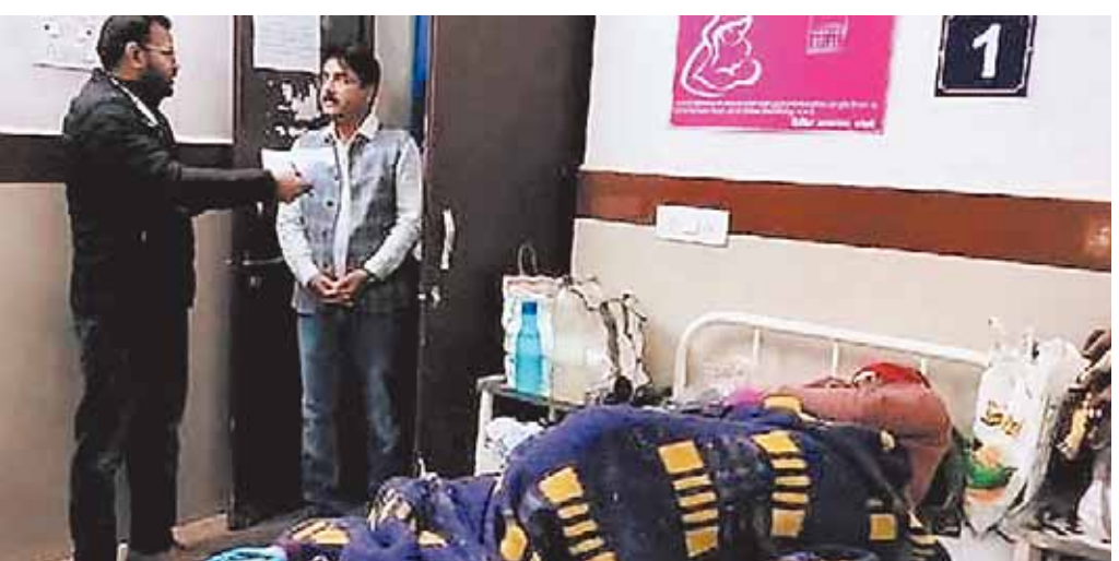
राज्यसेन, दोपहर मेट्रो

लोक स्वास्थ्य एवं परिवार कल्याण राज्यमंत्री नरेंद्र शिवाजी पटेल ने बरेली सिविल अस्पताल का औचक निरीक्षण किया। स्वास्थ्य राज्यमंत्री के विधानसभा क्षेत्र के अस्पताल का उनका