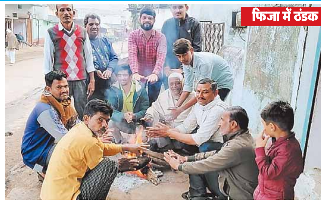
फिजा में ठंडक

सिवनी मालवा। विकासखंड के अंतर्गत पिछले एक हफ्ते से आसमान छाप रहे बादल आरिक्कार बरस ही गए दो दिनों से हो रही बारिश ने फिजा में ठंडक खोल दी है जिसके कारण लोगों को अलाव के सहारे लेते देखे गए।