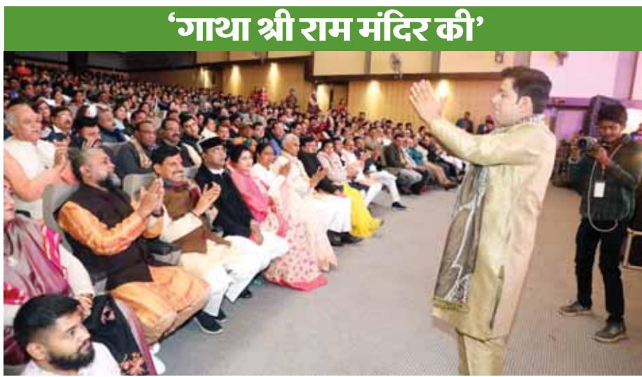
भोपाल। मुख्यमंत्री डॉ. मोहन यादव ने रविन्द्र भवन में 'गाथा श्रीराम मंदिर की' संगीतमय महागाथा का श्रवण किया।

भोपाल. जनजातीय कार्य विभाग के विशिष्ट आवासीय विद्यालयों में प्रवेश प्रक्रिया जारी है। आवेदन की आज अंतिम तारीख है। साथ ही परीक्षा प्रवेश पत्र 29 जनवरी को और परीक्षा 11 फरवरी 2024 को सुबह 10 से 12 बजे तक होगी। कक्षा 5 वीं में अध्ययनरत जनजाति वर्ग, विशिष्ट पिछड़ी जनजाति, विमुक्त जनजातियां, घुमकड़ समुदाय के बच्चे आवेदन कर सकते हैं।