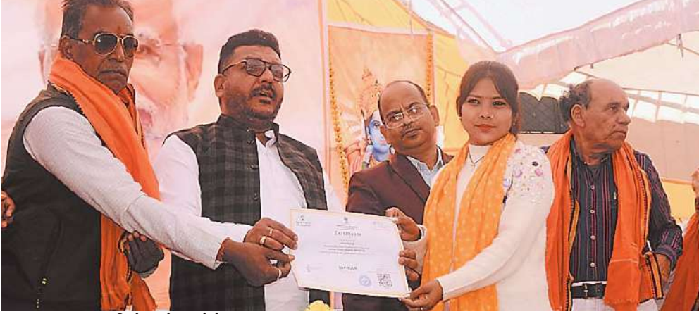
सिरोंज, दोपहर मेट्रो।

विकसित भारत संकल्प यात्रा के तहत नवीन बस स्टैंड पर आयोजित कार्यक्रम में, केंद्र सरकार द्वारा संचालित विभिन्न योजना से संबंधित अलग-अलग काउंटर लगाए गए थे। जहां पर योजनाओं से संबंधित आवेदन लेने के लिए विभागों के अधिकारी कर्मचारी बैठे हुए थे। यात्रा का उद्देश्य की केंद्र सरकार द्वारा संचालित योजनाओं का प्रचार प्रसार करके पात्र लोगों को लाभान्वित करने के लिए सभी मिलकर काम करें। विभिन्न विभागों के अधिकारी कर्मचारियों के साथ भाजपा के जनप्रतिनिधियों ने भी सरकार की योजनाओं के बारे में बताया।