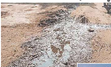
सिरोंज, दोपहर मेट्रो।

जनपद पंचायत लट्टेरी की ग्राम पंचायत में स्वच्छता के नाम पर टैक्स वसूला जा रहा है किसी से 300 तो किसी से 500 पर मूके पर हलात देखिए गंदगी ही गंदगी नजर आएगी स्वच्छ भारत के लिए पुरस्कार करने वाले नार तो जोर-जोर से लगाए जा रहे हैं के गंदगी को दूर भगाओ स्वच्छ भारत बनाओ स्वच्छ रहोगे स्वस्थ रहोगे शौचालय रखो सब नहीं लाओगे बीमारियां साथ नदियों को रखो साफ यह है हमारी