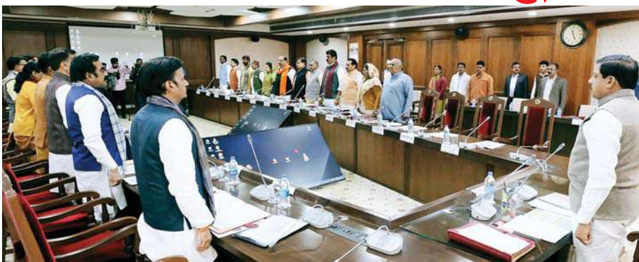
मुख्यमंत्री डॉ मोहन यादव की अध्यक्षता में मंत्री परिषद की बैठक मंत्रालय में वदे मातरम के गान के साथ आरंभ हुई।

मप्र सरकार की कैबिनेट बैठक में आज मुख्यमंत्री मोहन यादव ने प्रधानमंत्री जनमन योजना के प्रेजेंटेशन के बाद मंत्रियों से प्रचार-प्रसार और लाभ दिलाने की तैयारियों को लेकर चर्चा की। यह यादव सरकार की चौथी कैबिनेट बैठक है। इसमें निवेश बढ़ाने के लिए कुछ प्रस्तावों को मंजूरी मिली है। इसके अलावा अयोध्या में राम मंदिर में रामलला की प्राण प्रतिष्ठा को लेकर बैठक में चर्चा की गई। मुख्यमंत्री डॉ मोहन यादव ने मंत्रालय में हुई मंत्री परिषद की बैठक से पहले अपने संबोधन में चित्रकूट में कल 16 जनवरी को श्री रामचंद्र पथ गमन न्यास की पहली बैठक का उल्लेख करते हुए यादव ने कहा कि राम वन पथ गमन के विकास की कार्य