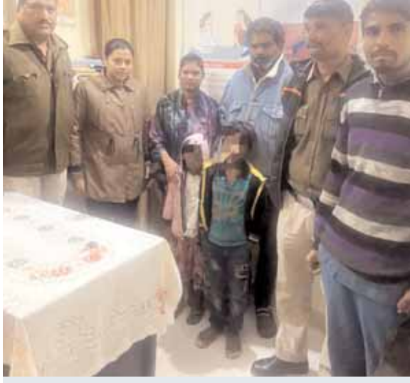
भोपाल, दोपहर मेट्रो