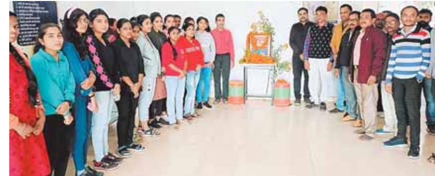
नर्मदापुरम, दोपहर मेट्रो