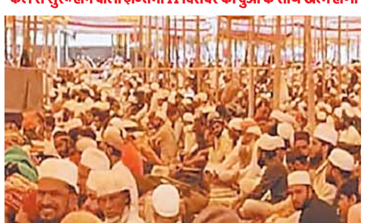
भोपाल, दोपहर मेट्रो।

राजधानी भोपाल के ईट खेड़ी स्थित घासीपुरा इलाके में 8,9,10,11 दिसंबर को होने वाले आलम तब्लीगी इज्तिमा की तैयारियां लगभग पूरी हो चुकी हैं। इंटखेडी स्थित इज्तिमागाह पर हर रोज बड़ी तादाद में पहुंचकर लोग श्रमदान यानी खिदमत कर रहे और तैयारियों पूरा करने में मदद कर रहे हैं। इधर शहर की मस्जिदों में अलग-अलग प्रदेशों की जमातों का आना शुरू हो गया है। जो फिलहाल स्थानीय मुलाकातों और इज्तिमा की