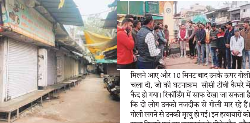
सिवनी मालवा, दोपहर मेट्रो