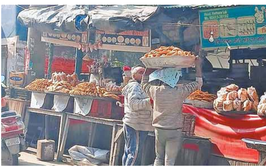
सिरोंज, दोपहर मेट्रो।

नगर में जिस तरह से खाद्य अधिकारी की नाक के नीचे कालाबाजारी और मिलावटी सामान सामान का विक्रय हो रहा है ऐसा नहीं है कि इस बात को कोई भी जिम्मेदार अधिकारी नहीं जानता है अफसोस इस बात का है कि सब कुछ जानते समझते हुए भी अधिकारियों की निष्क्रिय कार्यप्रणाली का खामियाजा आम आदमी को भुगतना पड़ रहा है, खाद्य अधिकारी के द्वारा सारे कार्य जैसे कि निरीक्षण करना आदि सब ऑफिस में बैठकर पूरे कर लिए जाते हैं। कभी किसी पेट्रोल पंप का निरीक्षण नहीं करती किसी खाद्य दुकान पर जाकर खाद्य सामान जांच नहीं करती मिष्ठान भंडारों होटलों पर कभी नहीं जाती,