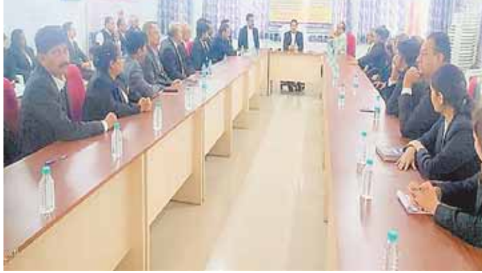
सीहोर, दोपहर मेट्रो।