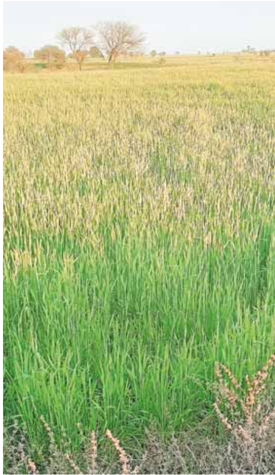
सिरोंज, दोपहर मेट्रो।

चार दिनों से मौसम में हूप बदलाव के बाद पानी गिरने से फसलों के लिए अमृत का काम भी हो गया। पिछले कुछ दिनों से मौसम में परिवर्तन के बाद से ही हल्की बारिश का दौर जारी है जिस तरह की बारिश की आवश्यकता किसने की थी उस तरह की बारिश पहले नहीं हो रही थी। आखिर चौथे दिन शहर के साथ कई ग्रामीण क्षेत्रों में अच्छी बारिश भी दर्ज हुई है। इस समय बरसात होने से किसानों की फसलों में फायदा भी नजर आने लगा है, एकदम से फसलों खेतों में लहराने लगी है। विकासखंड में सबसे कम बरसात होने के कारण क्षेत्र के किसान सूखे की मार क्षेत्र के किसान झेल रहे हैं। जिन किसानों के पास सिंचाई के लिए पानी नहीं है उनकी जमीन तो खाली ही पड़ी हुई है। इसी तरह एक बार और पानी गिरता है, तो उसे जमीन में भी फसल लगाने का काम किसान कर सकते हैं। जिन किसानों ने पहले बोनी कर दी उनकी फसलों के लिए या बरसात अमृत का काम भी कर रही है। बरसात होने के बाद किसान खेतों में यूरिया डालने का काम भी करेंगे इसके चलते यूरिया लेने के लिए गोदाम पर किसानों की भीड़ भी देखने को मिलेगी। सुबह की शुरुआत बारिश के साथ ही हुई दिनभर रुक रुक कर हल्की और तेज बरसात होने से जनजीवन को प्रभावित रहा अभी भी मौसम की तरह का बना हुआ है मौसम विभाग के द्वारा आने वाले दिनों में भी बरसात होने की संभावना जारी की है इस हिसाब से यदि बरसात आने