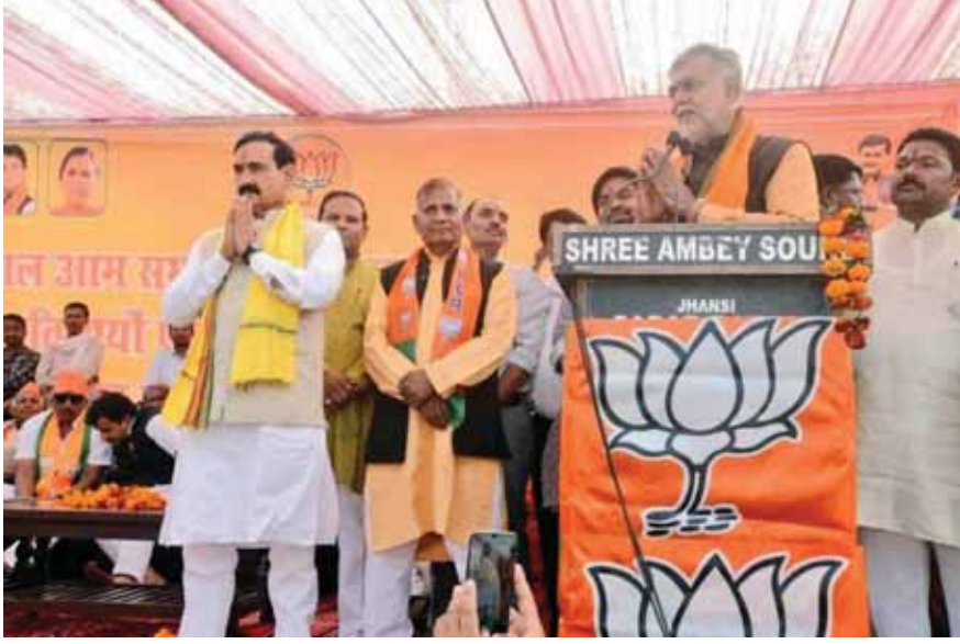
केन्द्रीय मंत्री प्रहलाद पटेल, नरोत्तम मिश्रा ने अशोकनगर, मुंगावली व दतिया में पार्टी प्रत्याशियों के समर्थन में की जनसभा।

भोपाल. जिले में नई मतदाता सूची सामने आने के बाद करीब डेढ़ लाख नए वोटर्स के नाम जोड़े गए हैं। जिनके वोटर कार्ड नहीं मिले इसमें से 90 हजार नए वोटर्स को कार्ड मिल गए हैं। इन्हें विधानसभावार डिस्पेच जा चुका है। कंट्रोल रूम से वोटर कार्डों को छंटने के बाद उन्हें विधानसभाओं में डिस्पेच कर दिया गया।