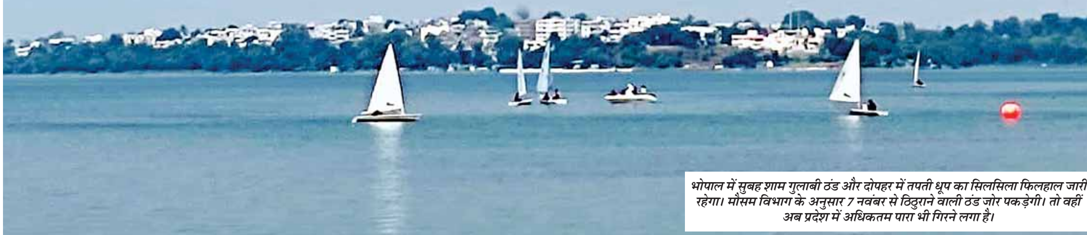
भोपाल में सुबह शाम गुलाबी ठंड और दोपहर में तपती धूप का सिलसिला फिलहाल जारी रहेगा। मौसम विभाग के अनुसार 7 नवंबर से ठिठुराने वाली ठंड जोर पकड़ेगी। तो वहीं अब प्रदेश में अधिकतम पारा भी गिरने लगा है।