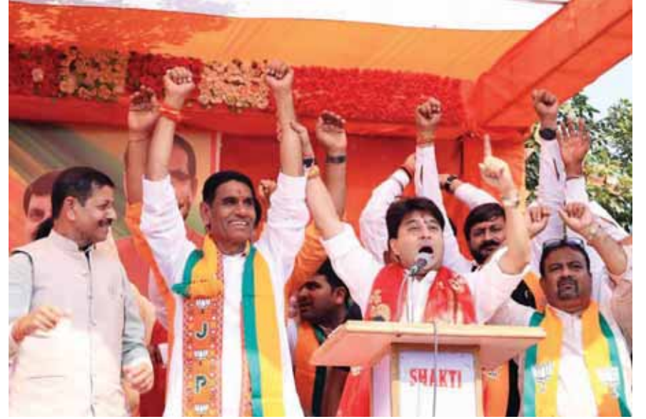
ज्योतिरादित्य सिंधिया ने मैहर, सुरखी, सांची और बदनावर में पार्टी प्रत्याशियों के पक्ष में जनसभा की।