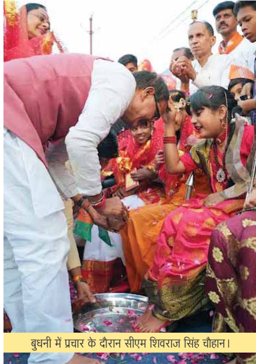
बुधनी में प्रचार के दौरान सीएम शिवराज सिंह चौहान।

आज केंद्रीय मंत्रियों की संभागों में 'ड्यूटी' विस चुनाव प्रचार के लिये आज सीएम शिवराज सिंह चौहान सीडेर, नर्मदापुरम, केंद्रीय मंत्री प्रहलाद पटेल बालाघाट एवं सिवनी, वीरेंद्र खटीक आगर, शाजापुर, शुजालपुर एवं सुसनेर, फगनसिंह कुलस्ते बिछिया, लांजी, बालाघाट एवं मण्डला में रहेंगे। वहीं गोपाल भार्गव मंधाला व खण्डवा, मनोज तिवारी रायसेन, सतना, प्रभात झा उज्जैन ग्रामीण, कविता पाटीदार रतनाम एवं उज्जैन ग्रामीण में पार्टी प्रत्याशियों के समर्थन में चुनाव प्रचार करेंगे।