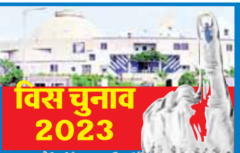
भोपाल, दोपहर मेट्रो