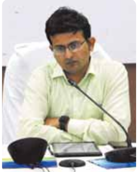
नर्मदापुरम, दोपहर मेट्रो