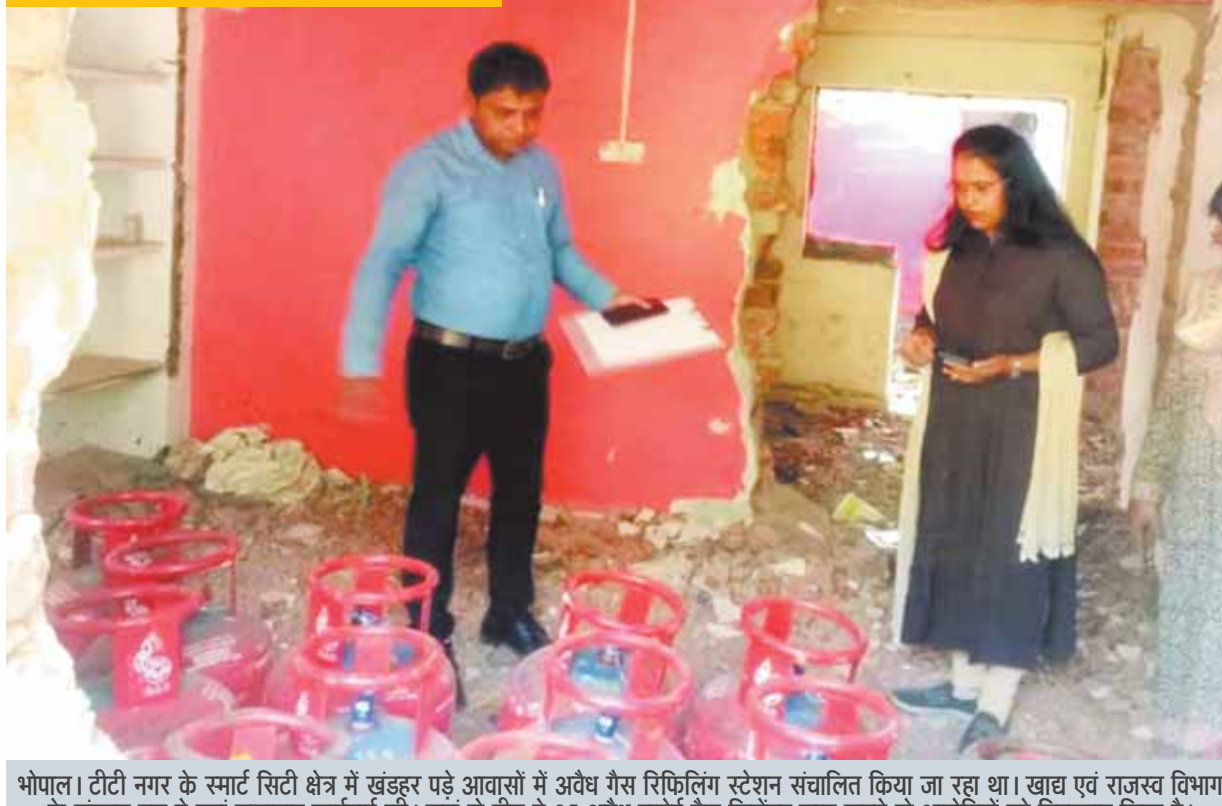
भोपाल। टीटी नगर के स्मार्ट सिटी क्षेत्र में खंडहर पड़े आवासों में अवैध गैस रिफिलिंग स्टेशन संचालित किया जा रहा था। खाद्य एवं राजस्व विभाग के संयुक्त दल ने यहां छापामार कार्रवाई की। जहां से टीम ने 95 अवैध रसोई गैस सिलेंडर जब्त करते दो आरोपियों को गिरफ्तार किया है।