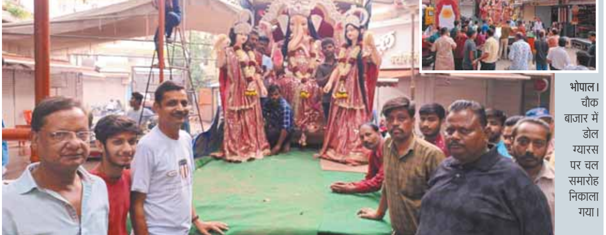
भोपाल। चौक बाजार में डोल ग्यारस पर चल समारोह निकाला गया।