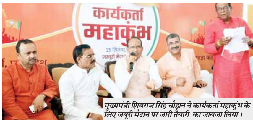
मुख्यमंत्री शिवराज सिंह चौहान ने कार्यकर्ता महाकुंभ के लिए जबूरी मैदान पर जारी तैयारी का जायजा लिया।