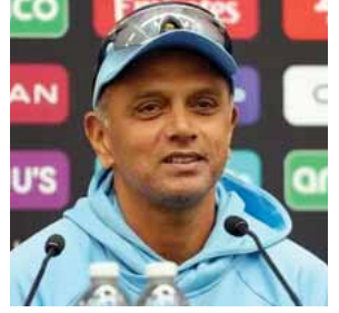
खिलाड़ी को वर्ल्ड कप टीम में अपनी जगह की चिंता करने की जरूरत नहीं है। कोच ने अनुभवी स्पिन ऑलराउंडर रविचंद्रन अश्विन और वाशिंगटन सुंदर को वर्ल्ड कप प्लान

का हिस्सा बताया और कहा- अश्विन-सुंदर को अक्षर पटेल के संभावित विकल्प के रूप में टीम में जगह दी गई है और अगर अक्षर जांच की चोट से उबरने में नाकाम रहते हैं, तो इन दोनों में से किसी एक को टीम में जगह मिल सकती है। इस सीरीज को अश्विन-सुंदर के बीच ट्रायल के तौर पर देखा जा रहा है, हालांकि कोच अश्विन जैसे खिलाड़ी के लिए ट्रायल शब्द का इस्तेमाल नहीं करना चाहते हैं। अगर हमारे पास अश्विन जैसा खिलाड़ी है, तो किसी के चोटिल होने पर हम और किस पर भरोसा कर सकते हैं।