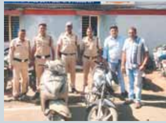
पुलिस के मुताबिक ग्राम ओमकारा

अयोध्या नगर पुलिस ने एक शातिर वाहन चोर को गिरफ्तार किया है। आरोपी के पास चोरी के 2 दोपहिया वाहन बरामद किए गए हैं। यह वाहन उसने अयोध्या नगर इलाके से ही चोरी किए थे।