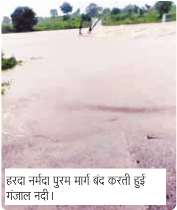
हरदा नर्मदा पुरम मार्ग बंद करती हुई गंजाल नदी।