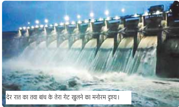
देर रात का तवा बांध के तेरा गेट खुलने का मनोरम दृश्य।