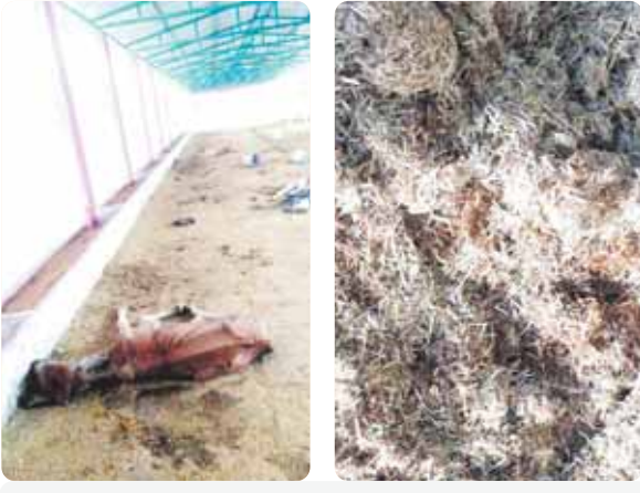
2 महीने पहले विधायक ने किया लोकार्पण, गौशाला में नहीं है पर्याप्त भूसा, आए दिन भूख और बीमारी से दम तोड़ रही गाय और बछड़े