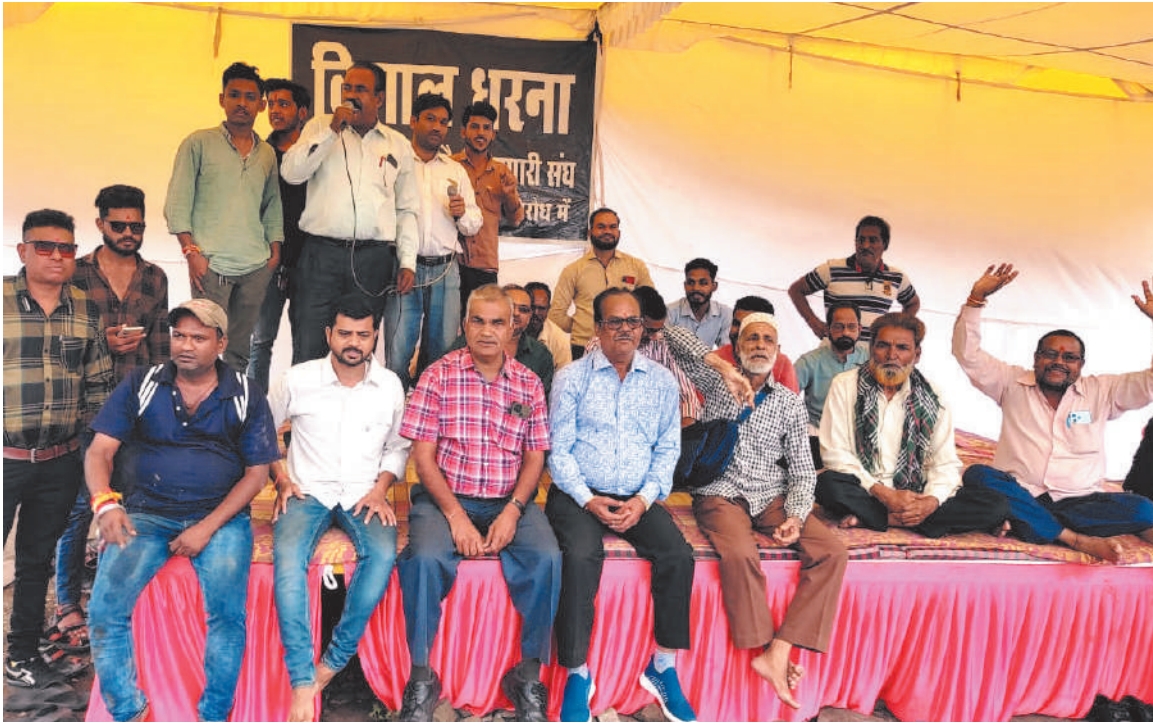
भोपाल। स्मार्ट सिटी में दुकान नहीं मिलने पर जवाहर चौक आदर्श व्यापारी संघ ने आज धरना दिया। लंबे समय से यह मांग चली आ रही है।