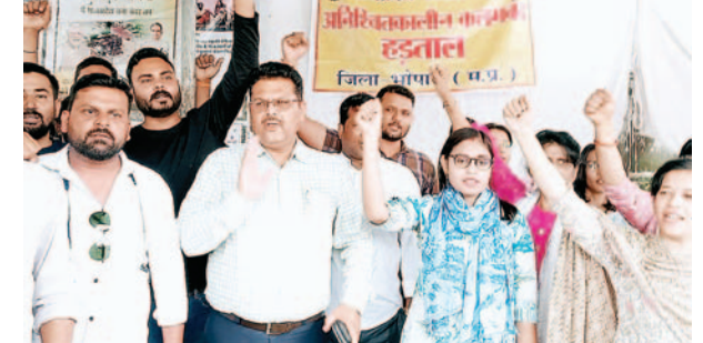
भोपाल। कलेक्ट्रेट ऑफिस पर पटवारी ने हड़ताल के दौरान धरना प्रदर्शन किया।