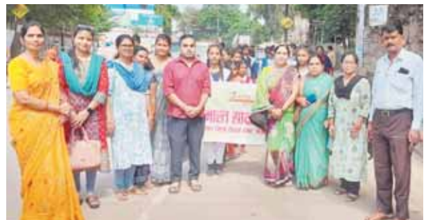
नर्मदापुरम, दोपहर मेट्रो।

शिक्षा सभी का जन्म सिद्ध अधिकार है। देश व्यक्ति एवं समाज का विकास तभी संभव है जब देश का प्रत्येक व्यक्ति शिक्षित होगा। शिक्षा न केवल व्यक्ति को शिक्षित करती है बल्कि उसके अधिकारों एवं कर्तव्यों को और भी जागृत करती है। शिक्षा के महत्व को प्रदर्शित कर 8 सितंबर को अन्तरराष्ट्रीय साक्षरता दिवसमनाया जाता है। जन जागृति हेतु उल्लास-नव भारत साक्षरता की जिले एवं विकासखंड स्तर की रैली का आयोजन श. क.उ. मा. वि., एस.