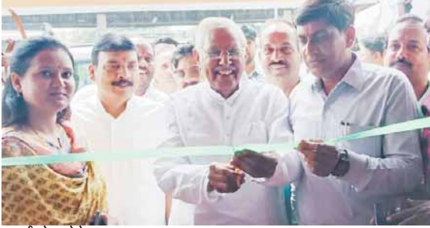
इटारसी, दोपहर मेट्रो।

इटारसी में दीन दयाल रसोई का शुभारंभ शनिवार को मप्र विधानसभा के पूर्व अध्यक्ष एवं नर्मदापुरम विधायक डॉ. सीतासरन शर्मा ने किया। दीन दयाल रसोई शहरी आजीविका केंद्र सिटी थाने के साइड में संचालित हो रही है। यहां 5 रुपये में भरपेट भोजन गरीब मजदूर भाईयों व बहनों को मिलेगा। वहीं, सिवनी मालवा नगर पालिका द्वारा दीनदयाल रसोई योजना के तृतीय चरण में दीनदयाल रसोई का शुभारंभ किया गया। इसके साथ ही नगरीय क्षेत्र के आवासीय भूमि के पट्टों के वितरण कार्यक्रम का आयोजन किया गया।