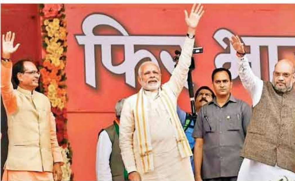
किसानों को लाभान्वित करने के लिये सरकार लगातार नई नीतियों पर काम कर रही

सरकार के लगातार प्रयासों और किसानों के लिए बनाई जा रही नीतियों के चलते लगातार 7 बार प्रतिष्ठित कृषि कर्मण अवार्ड प्राप्त करने वाले मध्यप्रदेश ने गेहूँ उत्पादन में पंजाब और हरियाणा को पीछे छोड़ दिया है। प्रदेश का सोने जैसे दानों वाला गेहूँ अमेरिका सहित अनेक देशों में निर्यात होता है। अब इसके निर्यात के लिए प्रयास बढ़ाए जा रहे हैं। प्रदेश में एक्सपोर्ट प्रमोशन कार्टिसल भी बनाई गई है। कृषि विकास दर जो वर्ष 2002-03 में 03 प्रतिशत थी, वह वर्ष 2020-21 में बढ़ कर 18.89 प्रतिशत हो गई है। खेती और एलाइड सेक्टर का बजट भी 600 करोड़ से बढ़कर 53 हजार 964 करोड़ हो गया। खाद्य उत्पादन भी इस अवधि में 159 लाख मीट्रिक टन से बढ़ कर 619 लाख मीट्रिक टन हो गया है। मध्यप्रदेश सरकार की दूरगामी सोच और किसानों जुड़ी योजनाओं को पूर्ण करने के लिए वर्ष 2023 में 53 हजार 964 करोड़ रुपए का बजट रखा गया, वहीं अगर बात 2003 की करें तब किसानों के लिए यह बजट मात्र 600 करोड़ रुपए का था।