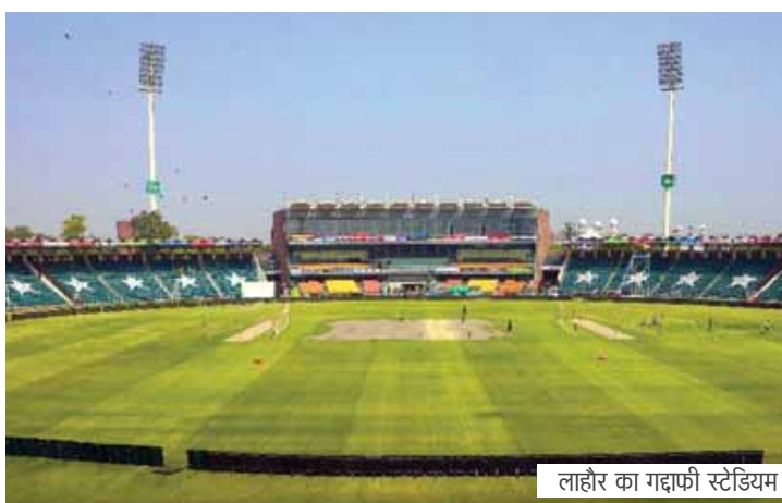
लाहौर का गद्दाफी स्टेडियम

अफगानी विकेटकीपर बल्लेबाज रहमानुल्लाह गुरबाज पिछले हफ्ते पाकिस्तान के खिलाफ वनडे सीरीज में टॉप स्कोरर रहे हैं। उन्होंने 58 की औसत से 174 रन बनाए। इसके एक शतक भी शामिल रहा। गुरबाज ने इस साल खेले 9 मैचों में 41.22 की औसत से 371 रन बनाए हैं। उन्होंने 2 शतक भी जमाया। इसके अलावा विकेट के पीछे 9 कैच पकड़े और 2 स्टंप भी किए। एशिया कप के पहले मैच में श्रीलंका के खिलाफ बांग्लादेशी विकेटकीपर मुशफ़्क़ुर रहमान का प्रदर्शन उतना अच्छा नहीं रहा। वे महज 13 रन बनाकर आउट हो गए।