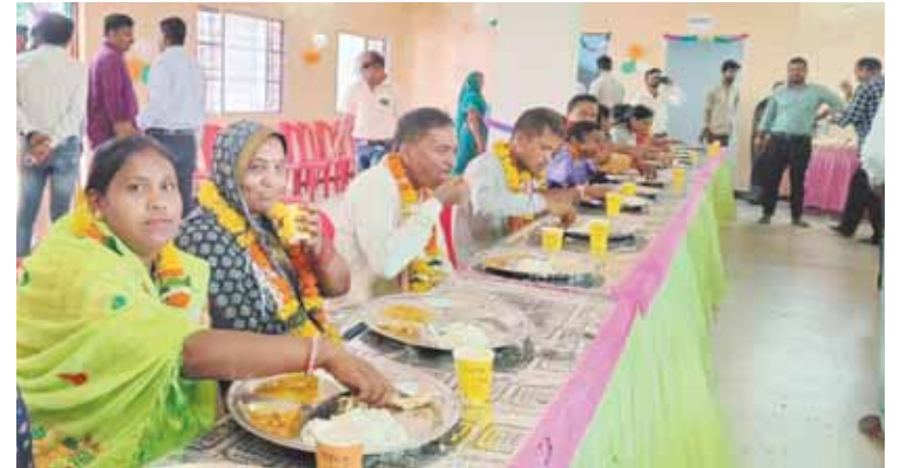
सिवनी मालवा, दोपहर मेट्रो।

नगर पालिका द्वारा दीनदयाल रसोई योजना के तृतीय चरण का शुभारंभ एवं नगरी क्षेत्र के आवासीय भूमि के पट्टे के वितरण कार्यक्रम का आयोजन किया गया। जिसमें मुख्यमंत्री शिवराज सिंह चौहान द्वारा लाइव प्रसारण के माध्यम से एमपी में 166 दीनदयाल रसोई का शुभारंभ एवं पट्टे का वितरण संपूर्ण मध्य प्रदेश में कराया गया जिसमें विधायक प्रेम शंकर वर्मा, नपा अध्यक्ष रितेश जैन द्वारा सिवनी मालवा क्षेत्र में 1 दीनदयाल रसोई का शुभारंभ किया गया जिसमें 5 रुपए में दीनदयाल रसोई योजना अंतर्गत भरपेट भोजन उपलब्ध करवाया जाएगा। इसके अलावा नगरीय क्षेत्र के आवासीय भूमि के पट्टे का वितरण भी कराया गया। नपा अध्यक्ष रितेश जैन ने बताया कि सिवनी मालवा के नागरिकों को आज एक ओर सौगात मिली है जिसमें दीनदयाल रसोई योजना 5 रुपए थाली खाना का शुभारंभ एवं आवासीय भूमि के पट्टे के वितरण का कार्य करवाया गया साथ ही सभी को बधाई दी गई।