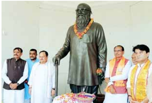
जन आशीर्वाद यात्रा के दौरान चित्रकूट पहुंचे भाजपा के राष्ट्रीय अध्यक्ष जेपी नड्डा, मुख्यमंत्री शिवराज सिंह चौहान, केंद्रीय मंत्री नरेंद्र सिंह तोमर, ज्योतिरादित्य सिंधिया एवं प्रदेश अध्यक्ष वी डी शर्मा ने आरोग्य धाम में भारत रत्न नानाजी देशमुख की प्रतिमा के समक्ष कि श्रद्धा सुमन अर्पित।

इधर मप्र कांग्रेस चीफ कमलनाथ ने कहा है कि 'आज भाजपा में अपराधबोध जागा है। जन आशीर्वाद यात्रा' करके जनता तक जाने की जरूरत इसलिए पड़ रही है क्योंकि उनके काम जनता तक नहीं पहुँचे। अगर भाजपा जनता के बीच 'क्षमाप्रार्थी' बनकर जाएगी तो आशा है मध्यप्रदेश की बड़े दिलवाली जनता औपचारिकतावश उनकी यात्रा को पानी तो पिला दे, लेकिन भाजपा को वोट नहीं देगी।' नाथ ने कहा कि मप्र में भाजपा दो रिकार्ड बनाने जा रही है- सबसे ज्यादा झूठी घोषणाओं का और सबसे ज्यादा वोटों से हारने का।