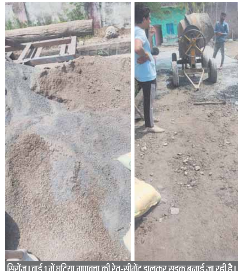
सिरोंज। वार्ड 1 में घटिया गुणवत्ता की रेत-सीमेंट डालकर सड़क बनाई जा रही है।